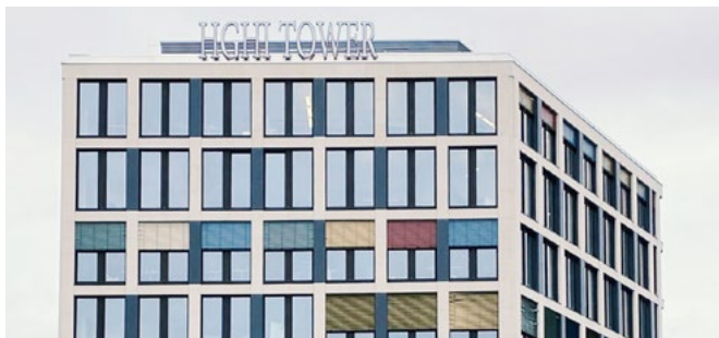
HGHI Tower, CLP Büro Berlin

Als mitgeschäftsführender Gesellschafter der CLP Akademie referiert er bundesweit sowohl inhouse für die CLP Akademie als auch für diverse kommunale Studieninstitute. Mit seinem Zertifizierungslehrgang zum Vergabemanager/-in hat er in mehreren Bundesländern den deutschlandweit ersten Grundstein für eine umfassende vergaberechtliche Ausbildung gelegt. Er publiziert außerdem regelmäßig zu vergaberechtlichen Themen. Darüber hinaus ist er als Berater im Rahmen der Implementierung von Compliance-Management-Systemen tätig. (*Risikomanagement-Beauftragter entsprechend den Anforderungen der ONR 49003)